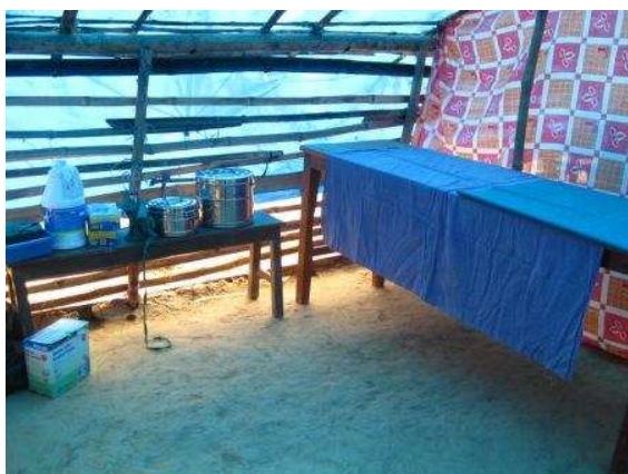
Il locale dedicato al check-up di donne e bambini

I "locali" per le visite sono stati realizzati sul letto del fiume, all'interno di un tendone noleggiato per l'occasione, nonché all'interno di una tenda di bambu' e teloni di plastica che viene utilizzato come "mettong hall" durante gli incontri con la comunità'.