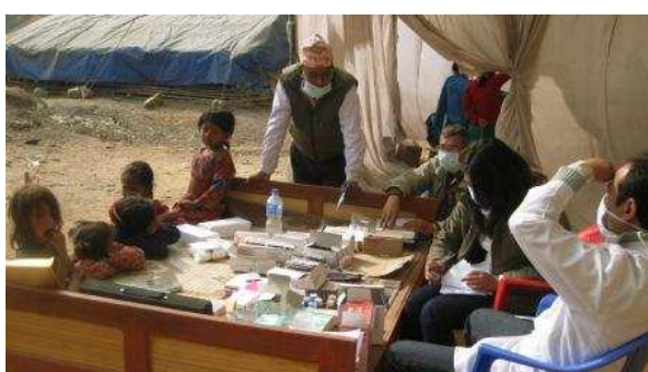
Due immagini del dispensario in azione.

Si e' avuto cura di fare in modo che i bambini venissero sempre accompagnati dai genitori al dispensario, per essere certi che le modalita' di assunzioni dei medicinali venissero comprese chiaramente.