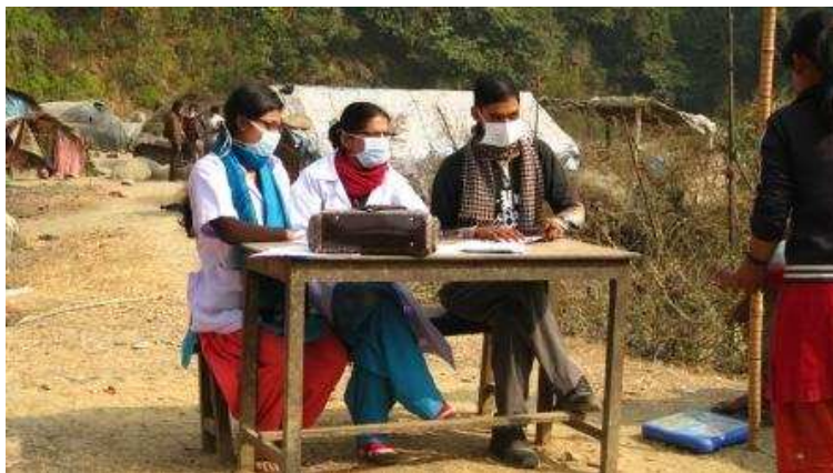
I volontari dedicati alla registrazione dei pazienti

Il campo prevedeva una prima postazione dedicata alla registrazione dei pazienti. In questa fase veniva compilata dai volontari una scheda in doppia copia con i dati generali dei pazienti: nome e cognome, provenienza ed età'.