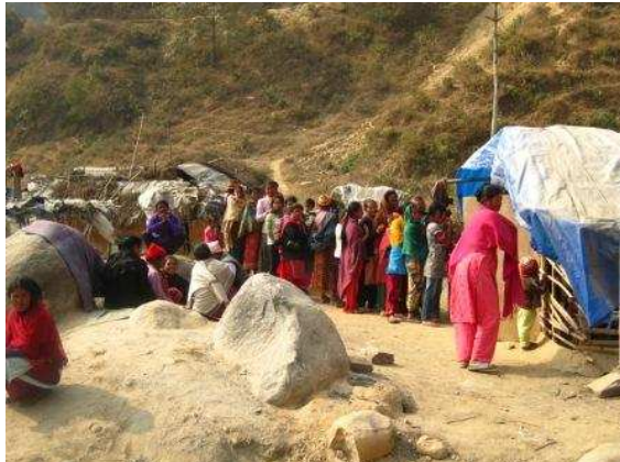
Un volontario misura altezza e peso dei bimbi in fila Intanto la fila dei pazienti accorsi al campo, si allunga

Successivamente il paziente veniva indirizzato dal dottore di pertinenza che era diverso per le donne, per i minori e per gli uomini.