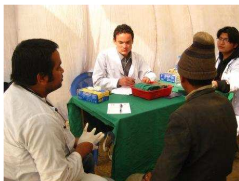
Due foto scattate nel settore dedicato ai bambini e agli uomini

Al termine della visita il medico segnava nella scheda la diagnosi nonché le prescrizioni mediche necessarie.